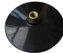
RL-STU04 178 mm Ø hart → Seite 3.079