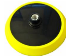
RL-STP05 170 mm Ø weich → S. 3.079