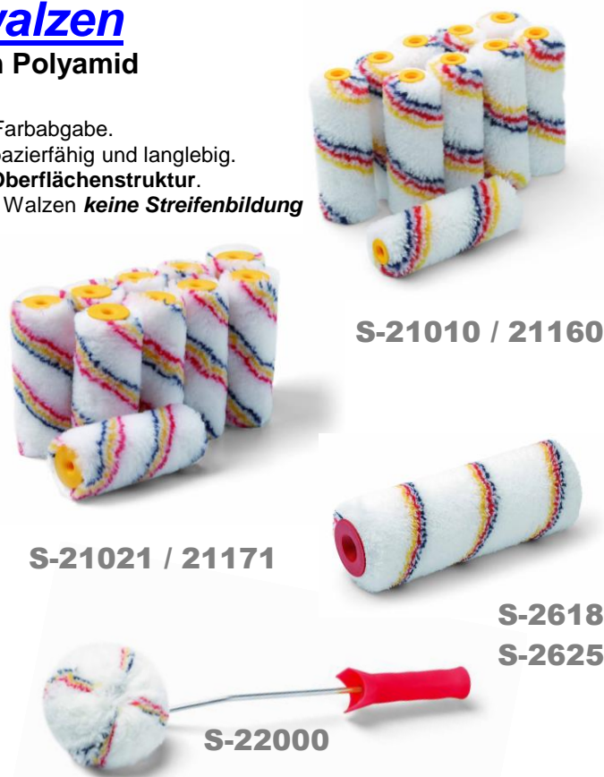
S-21010 / 21160