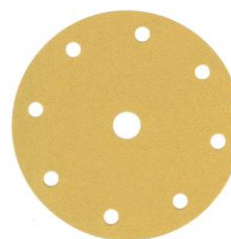
Festo-Lochung 9-fach gelocht / 8 + Mittelloch