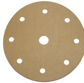
8 + 1 Loch für FESTO-Schleifmaschinen Lochkreis-Ø 120 mm