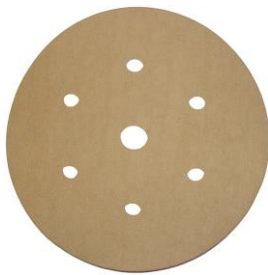
7-fach gelocht Lochkreis-Ø 80 mm

Das Besondere: Der Staub bindet sich an der Schleifscheibe, d.h., es staubt kaum bis gar nicht beim Schleifen.