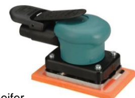
für Schleifer DY-58503 ohne Absaugung