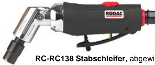
RC-RC138 Stabschleifer, abgewinkelt