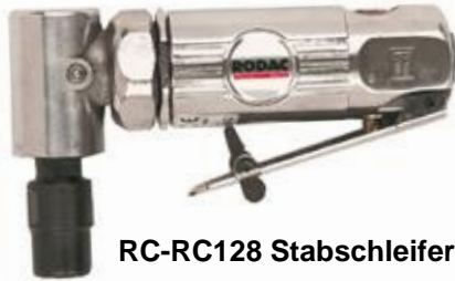
RC-RC128 Stabschleifer, abgewinkelt

RC-RC530L Stabschleifer, lange Ausführung