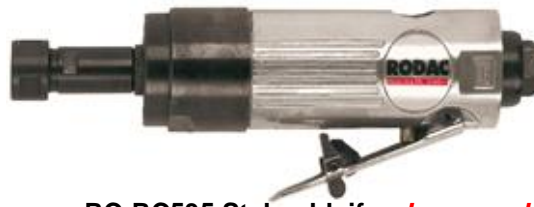
RC-RC535 Stabschleifer, Langsamläufer

In Kombination mit einem Roloc-Adapter können Sie auch Roloc-Schleifscheiben verwenden: